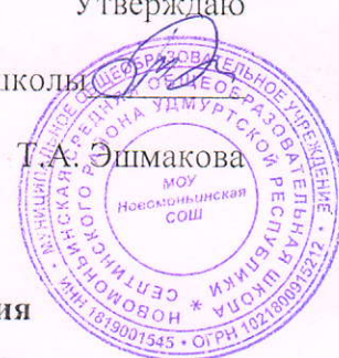
График родительского контроля за организацией питания

В МОУ «Новомоньинская СОШ» в 2023-24 учебном году